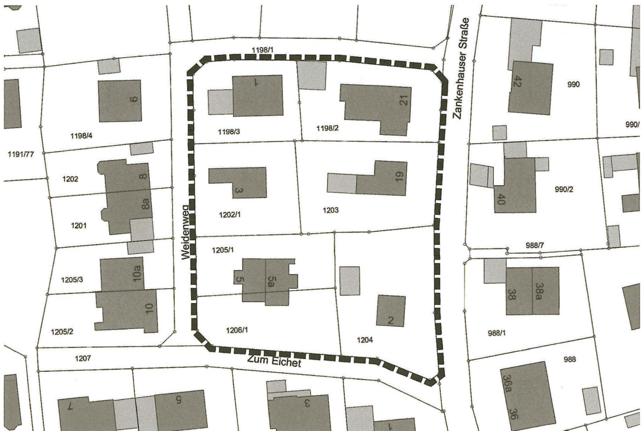
Abbildung: Geltungsbereich der Veränderungssperre, ohne Maßstab